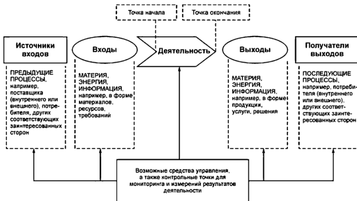
Рисунок 1 дает схематичное изображение любого процесса и иллюстрирует взаимосвязь элементов процесса. Контрольные точки мониторинга и измерения, необходимые для управления, являются специфическими для каждого процесса и будут варьироваться в зависимости от соответствующих рисков.